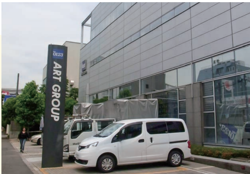
東京オフィス外観