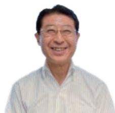
東京本社 総務部 障がい者雇用担当

担当者は、1年間ハローワークに通いながら都内の保育園の雇用事例を見学し、現在の雇用から定着までの流れを作っていました。