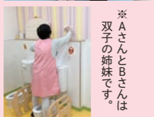
※AさんとBさんは 双子の姉妹です。