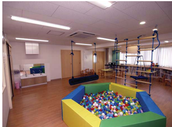
「アートチャイルドケア SED スクール近鉄学園前」教室

これまで保育所を数多く運営していく中で、発達について気になるお子様が観察されており、一部保育所では、発達障害と診断されたお子様に対して、保育士の加配や専門要員が巡回するなどにより、保育の観点から、気になるお子様への環境づくりを実施してまいりました。