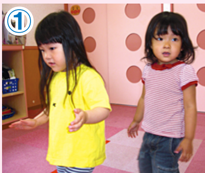
① 汽車の車輪のイメージで、手を腰の横で動かしながら出発。