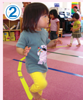
② AからDにかけリズムに合わせて加速して走る。最後はDからAに戻りクールダウン。