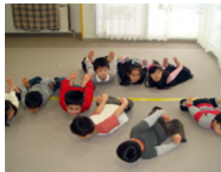
お部屋での体操、みんな上手にできるかな～

冬の北海道は寒さも厳しいですが、お天気の良い日には、雪遊びやソリ遊びを楽しみます。室内ではリトミックや歌に力を入れており、絵本の読み聞かせもお子様達が大好きです。